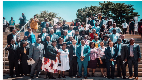
Aferika I Saute